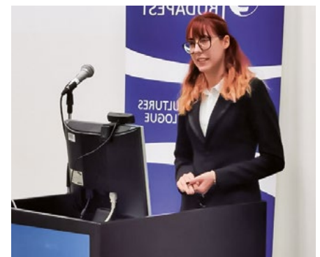
Hankó Viktória a Security and sovereignty in the 21st century nemzetközi konferencián

fórumokon, mint a X. Infotér Konferencia, Ethical Hacking Day, Hacktivity Conference, AI Forum Hungary, T-Systems CTRL SOC, SOFT CAPS 2019. Külön szeretnénk megköszönni, az egyetemi oktatók karának és mentortanárainknak