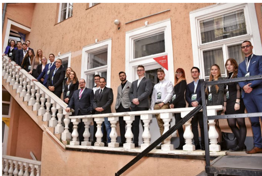
A 2019-es Nemzeti Kiberverseny résztvevői

Célunk, hogy minél több mentorált tagunkat felkészítsük a nemzetközi szintű tudományos megjelenésre. 2019-ben három hallgatótársunk is reprezentálta szakmai munkáját idegen nyelven nemzetközi konferenciákon; MBF X Confe-