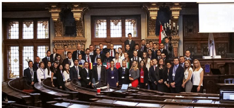
A 2019-es NATO 70 szimulációs verseny résztvevői

A Nemzetbiztonsági Szakkollégium az Egyetemünk intézményfejlesztési tervével összhangban, miszerint a hallgatók is bevonásra kerülnek a tudományos teljesítmény mérésére során, a tudományszervezésre